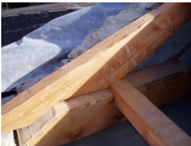
Foto 7: Detailpunkt Unterzug, Fußschwelle, Sparren mit Aufschiebling