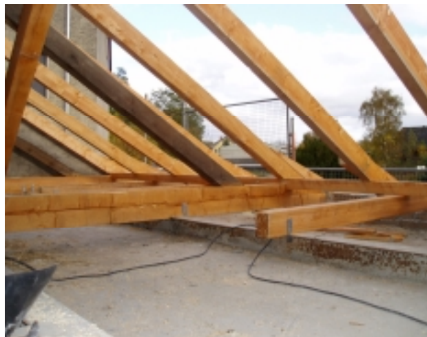
Foto 6: Sanierter Unterzug und neue Zwischenträger zur Unterstützung der Fußschwelle