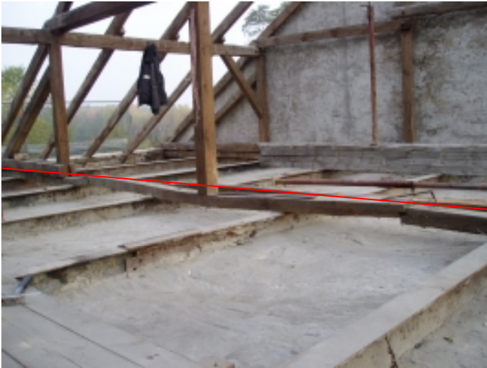
Foto 1: Stark verformter Unterzug unter den Pfosten der Mittel- und Firstpfette

Der Durchhang betrug ca. 15cm aufgrund des unzureichenden Holzquerschnittes der drei Unterzüge. Auf Aussage des Bauherrn entstand dieser dreifach stehende Pfettendachstuhl in den sechziger Jahren, d.h. die damaligen Zimmerleute hatten keine größeren Holzquerschnitte und Längen zur Verfügung. Dies könnte der Grund sein, warum solch unterdimensionierte Holzquerschnitte verwendet wurden.