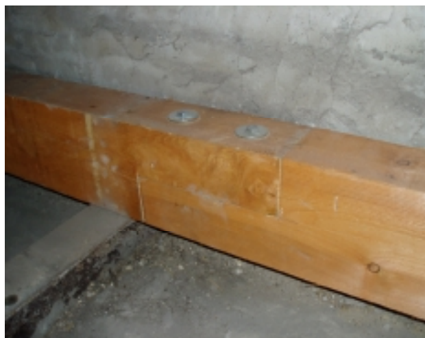
Foto 8: Detailpunkt Unterzug - Längsstoß als liegendes Blatt mit Bolzen als Lagesicherung